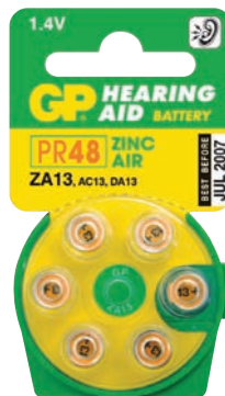
ZA 13 D6