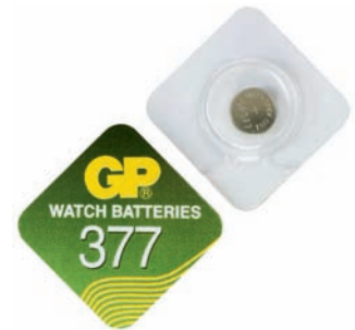
GP 377 A1