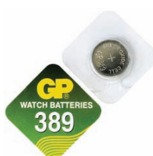
GP 389 A1