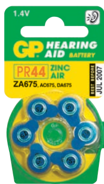
ZA 675 D6

EAN-koodit: 6-pack: 4891199005152 Display box: 4891199026478 Laatikko: 4891199036118