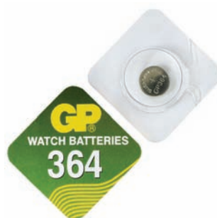
GP 364 A1