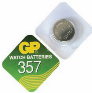
GP 357 A1