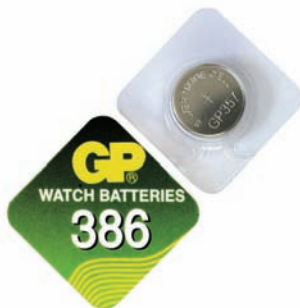
GP 386 A1