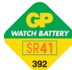
GP 392 A1